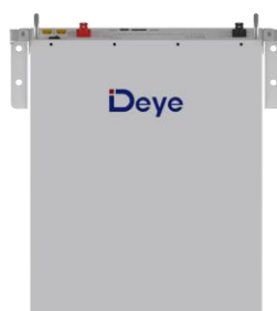
Встановлення на стіну