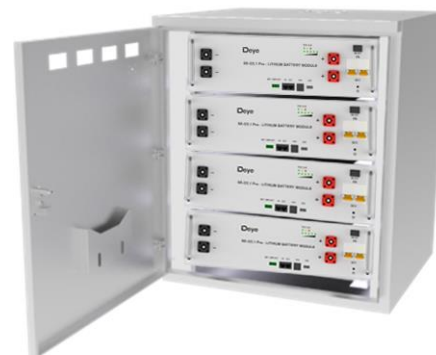
Встановлення в стійку